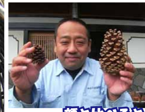
顔と比べると・・・