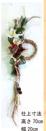
仕上寸法 高さ 70cm 幅 20cm