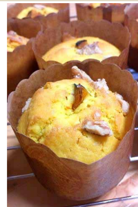
▲かぼちゃのマフィン。ホクホクに焼きました。

野菜以外に、広島産の「芋」だけで作ったこんにやく、古漬け、梅を使ったジュースやジャム等を並べました。リピート確実！な味わいです！！ 次回は来年2月を予定しております。お楽しみに♪