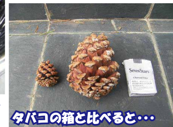
タバコの箱と比べると・・・